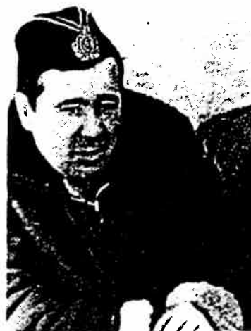
Командир подводной лодки Б-59 капитан 2 ранга Валентин Савицкий

А противолодочные силы противостоящей стороны, особенно авиационные, с самого начала движения к берегам Кубы были готовы к встрече с нами. И хотя я и другие командиры осназовских групп заранее знали о целях и маршруте перехода, без чего просто немислимо было планировать и строить нашу работу, но такого противодействия не ожидали. Сначала нас искали норвежские гидросамолеты, на Фарерском рубеже – английские «шэклтаны». Им на смену пришли американские «нептуны». Но, судя по всему, обнаружить нас не смогли. Во всяком случае, до тех пор, пока мы не добрались до Саргассова моря. Вот там-то они взяли нас в оборот. Против Б-59 действовала авианосная поисково-ударная группа во главе с авианосцем